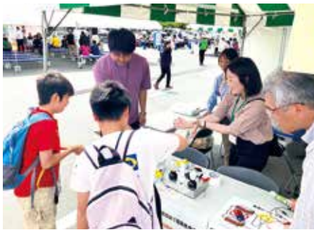
楽しみながら、発電の仕組みを学ぶ子どもたち

親子連れを中心に400名近い方々にブースにお越しいただき、発電の仕組みや省エネの大切さについて、体験を通じて学んでいただきました。