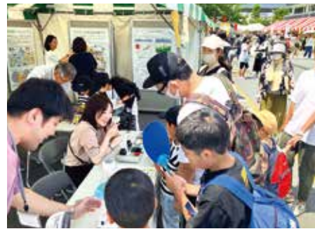
沢山の方にお越しいただきました!