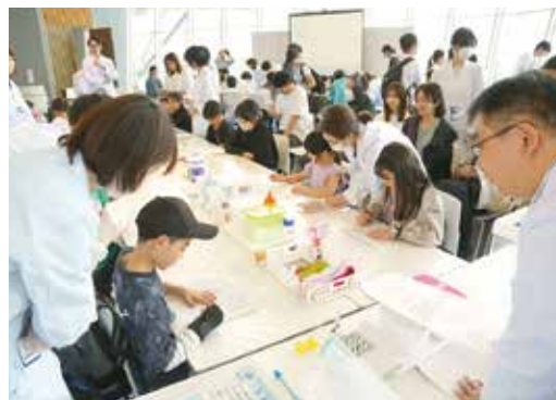
講師による説明に熱心に耳を傾け、クイズに答える子どもたち