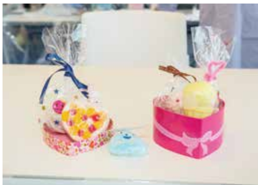
素敵なお風呂剤がたくさんできました!