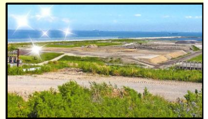
バスで処分場見学