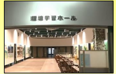
学習ホールで座学